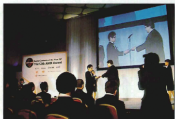
▲ミヤング授賞式の様子

総務省の所管する社団法人デジタルメディア協会（AMD）では、デジタルコンテンツの質的向上並びに人材育成を目的として、平成7年度からAMDアワード・デジタル・コンテンツ・オブ・ジ・イヤーを開催、優秀なデジタルコンテンツを表彰し、その功績を讃えてきました。