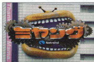
▲ミヤング オープニング画面

季節のイベントごとに動画が振り分け・蓄積されるチャンネル機能や、利用者が動画に対するコメントを投稿できる機能など、地域コミュニティとしての機能も充実しています。