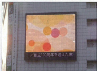
▲アオバビジョン（仙台駅前大型ビジョン）